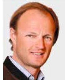
Erlaucht Graf Clemens zu Waldburg-Zeil Lustenau-Hohenems, Schirmherr